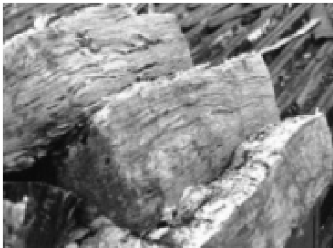
Рис. 3. Расслоение минеральной ваты при намокании и разрушении связующего