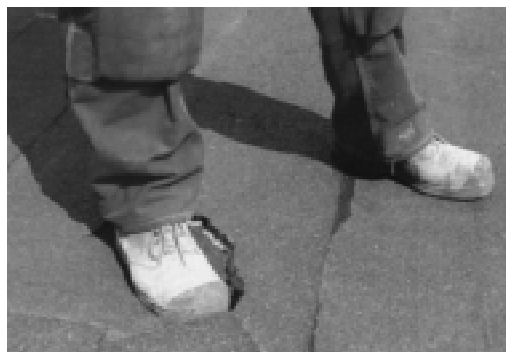
Рис. 6. Прорыв гидроизоляции из-за потери прочности на сжатия минераловатных плит

же для склеивания стекловолокна требуется большее количество связующего.