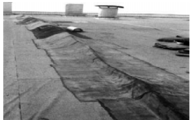
Рис. 2. Повреждение кровли из пенополистирольных плит

плоской крыши. Благодаря ячеистой структуре (до 75–95% закрытых пор) вспененные пластики практически водонепроницаемы, но паропроницаемы (сопротивление проникновения диффузии водяного пара M = \text{от } 0,03 \text{ до } 0,07 ). Водяной пар в таких системах проникает в ячейки, конденсируется и удерживается внутри ячейки. Это происходит с завидной регулярностью. В сочетании с эффектом всасывания (выдавливанию) наружного воздуха и пара, происходящего из-за разницы давлений, это приводит к тепловому дрейфу.