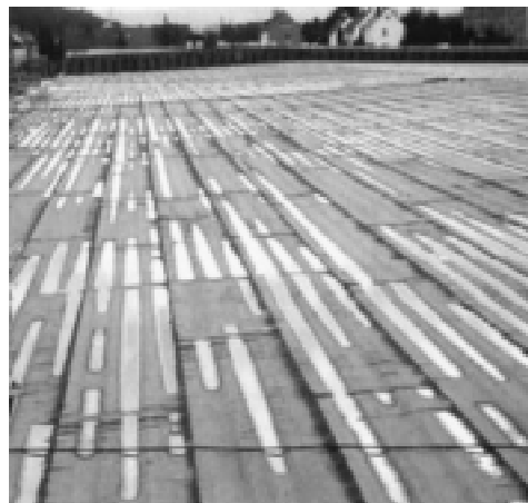
Рис. 5. Основание из профнастила с уложенной минеральной ватой. Усадка теплоизоляции во впадинах профнастила из-за потери механической прочности

Аналогичные разрушения происходят и в стекловолоконных утеплителях, однако, значительно быстрее. Плотность стекловолоконных плит, как правило, ниже, чем у минеральной ваты, меньше и прочность на сжатие. К тому